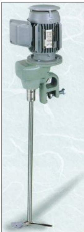
N K A