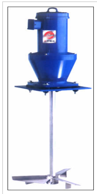
各类搅拌形式（叶轮）