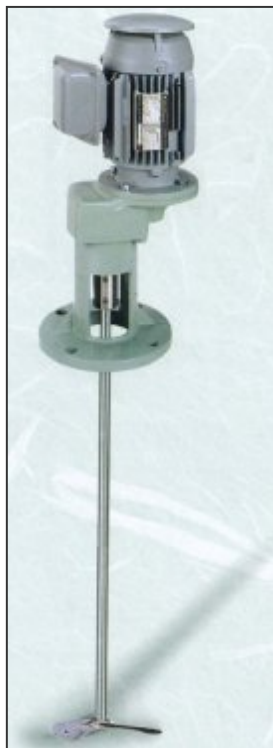
N T A